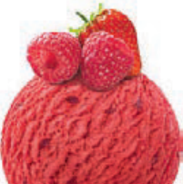
RASPBERRY & STRAWBERRY