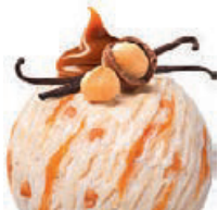
MACADAMIA DULCE DE LECHE