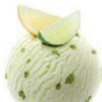
LEMON & LIME

La boule CHF 4.10 Pro Kugel CHF 4.10 Per scoop CHF 4.10