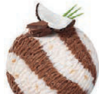
COCONUT & CHOCOLATE