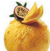
PASSION FRUIT & MANGO